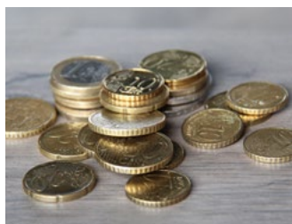
1 Tarieven loonbelasting, premies en heffingskortingen

Deze special bevat actuele cijfers en relevante wet- en regelgeving op onder meer het gebied van de loonbelasting, gebruikelijk loon, de auto van de zaak, de WKR, subsidies voor de werkgever, diverse arbeidsrechtelijke zaken en pensioenen. Aan het einde van dit document is een aantal tabellen met cijfers en tarieven voor 2024 opgenomen.