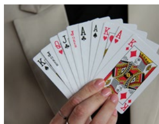
7 Varia arbeidsrecht en sociaal zekerheidsrecht